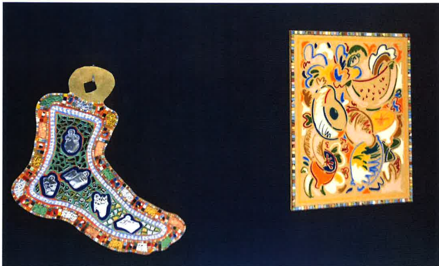
Sol Calero, Pie , 2018 ; Frutas friestal 2 , 2018.