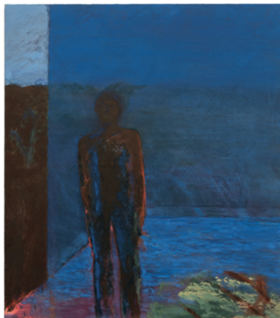
Le Soleil tout le jour a brûlé, 2023 Huile sur toile, 195 x 171 cm Oil on canvas, 76.8 x 67.4 in.

L'artiste broie elle-même ses couleurs et prépare sa toile selon une alchimie précise, elle obtient ainsi une qualité de matité et de lumière qui n'appartient qu'à elle. Elle donne vie à des images indéfinissables et évanescentes, comme dans un rêve.