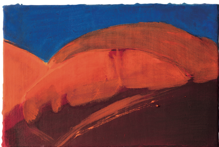
Le Soleil brulant un côté de mon visage, 2020 Huile sur toile, 16 x 24 cm Où on capture, 6,3 x 9,5 m.

Pour autant, ce relief physique ne contredit pas une certaine retenue dans l'expression figurative de personnes, de corps et de paysages.