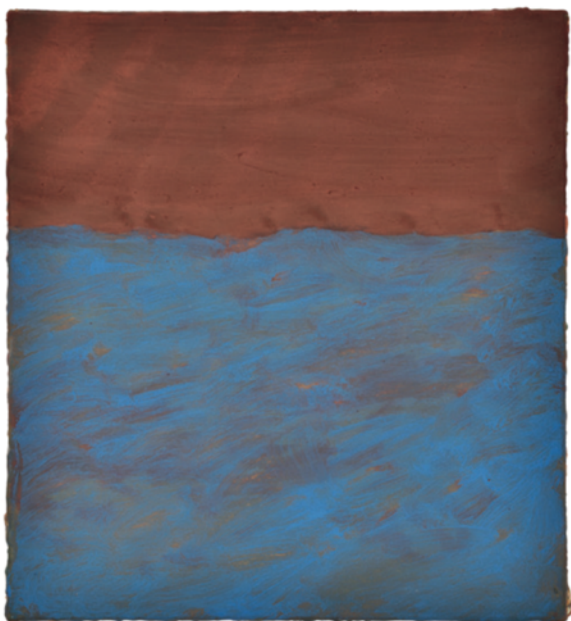
Horizon, 2022 Huile sur toile, 35 x 32 cm Oil on canvas, 13.8 x 12.6 in.