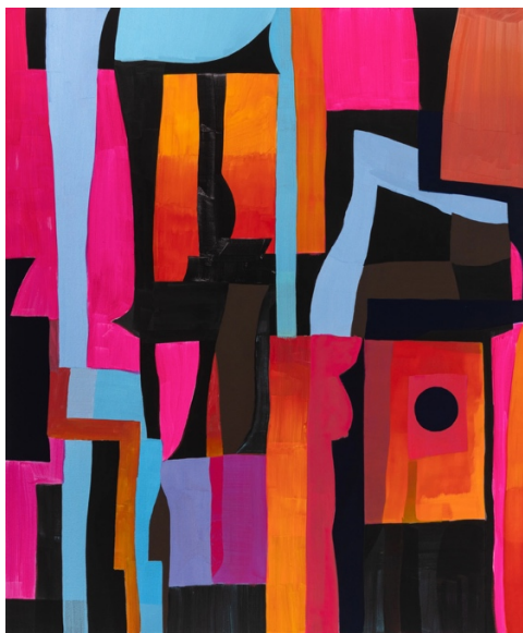
Pain I, 2023 Acrylique sur toile 183,1 x 152,7 cm