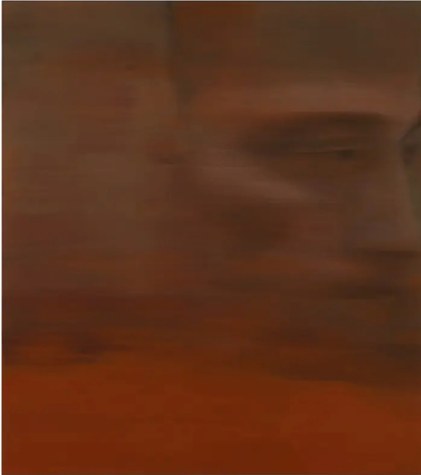
Two officials oversee Chernobyl's catastrophe, 2025 Huile sur toile 130 x 115 cm

« C'est comme si l'effacement était la seule façon de lutter contre l'oubli affectif que peut générer l'histoire : on tend vers l'abstraction, mais quelque chose résiste. Un visage. »