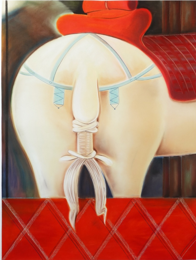
Patterns (big horse), 2025 Pastel tendre sur papier 160 x 120 cm

« Le pastel est un médium poreux, il se situe dans cet interstice virevoltant entre dessin et peinture où nous aimons faire des expériences tous azimuts : il nous permet, sur de grands formats, de travailler au doigt, dans un rapport direct au corps. En outre, il a longtemps été considéré comme un genre mineur et ainsi a fourni aux femmes artistes du XVIIIe siècle une entrée dans la peinture, parce qu'il était accessible, pouvait se pratiquer dans la sphère domestique, sans grande formation technique. Nous aimons prolonger cette histoire de femmes. »