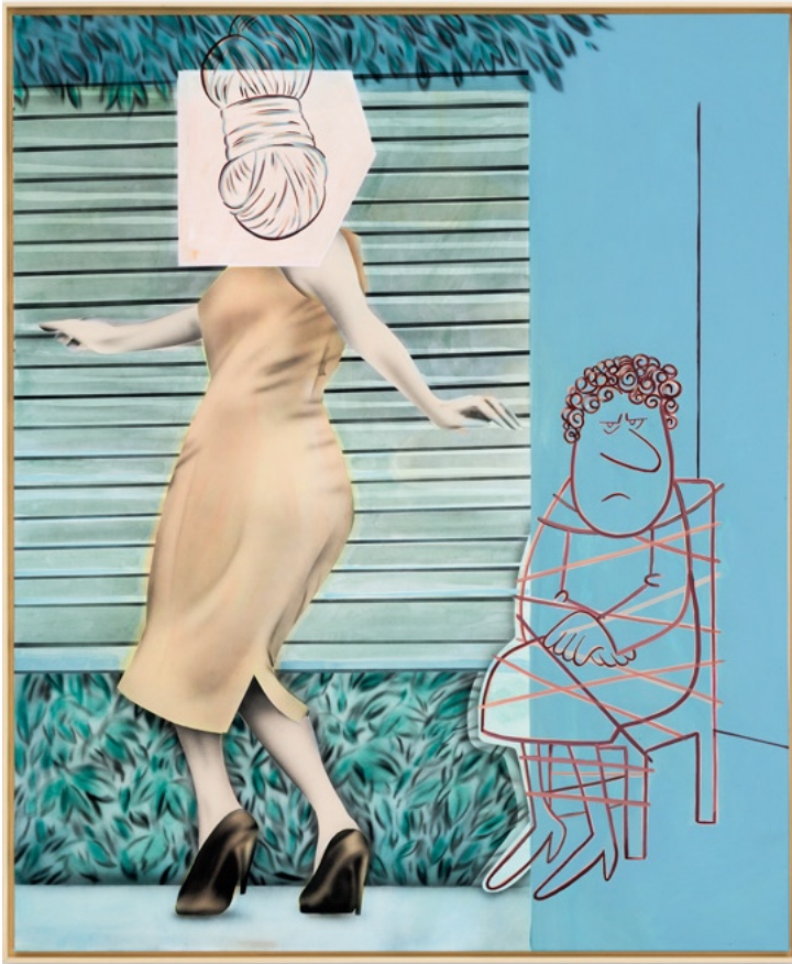
Bebop , 2022 Acrylique et encre sur toile 169 x 140 cm

« Rebattre les cartes pour, sans trop y insister, lever le voile sur les implicites, les non-dits, les rôles et les codes d'autant plus communément admis qu'ils sont arbitraires ? Et libérer du même coup, en une facétieuse farandole, le plaisir de la connaissance, la recherche du sens et une aspiration à l'égalité, ralliés par l'humour, cette connivence de plain-pied. »