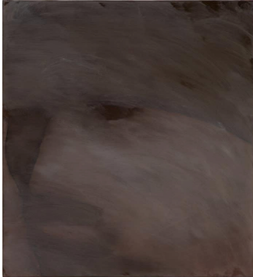
Invasion de la Finlande, 1939 Prisonnier Russe, 2025 Huile sur toile 75 x 68 cm

« Je ne peux pas peindre les oppresseurs ou les opprimés de manière neutre. On ne peint pas un prisonnier nazi comme n'importe quel autre sujet. Le noir et blanc est un geste. Le traitement statuaire, symétrique des traits, par exemple. Il y a aussi une notion de respect dans le fait d'indiquer ce qu'on regarde et d'où ça vient. Mes titres sont souvent très descriptifs, scientifiques : « Prisonnier russe en 1944 ». Ce sont des images très sérieuses. C'est d'une certaine manière une façon de répondre aux événements géopolitiques d'aujourd'hui, et ainsi tenter d'éviter que l'histoire se répète. »