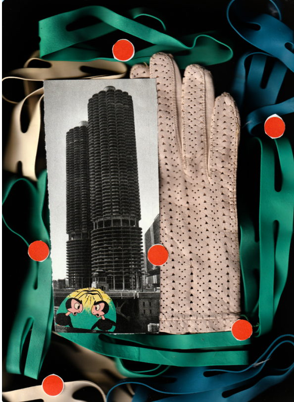
Serie Fabules , 2023 Scanogram 21 x 29,7 cm

« L'œuvre qui en résulte a pour méthode le collage, abordé comme un carnet de croquis, dans l'esprit aussi sérieux que joueur des expérimentations Dada, alimentée par une curiosité, au carré, pour les images, collectées hors de toute hiérarchie et au gré de flâneries plus ou moins lointaines, cette esthétique du détail signifiant et grossi, de la collision et du calembour visuel, cette bigarrure digne d'un costume d'Arlequin, délivre son message par le coq-à-l'âne, les associations et les rimes plastiques. De corps de femmes en fragments masculins, héros sans qualité, corps élastiques, simplifiés et sans genre, animaux anthropomorphes, monstres, motifs floraux, constructions géométriques ou éléments décoratifs. »