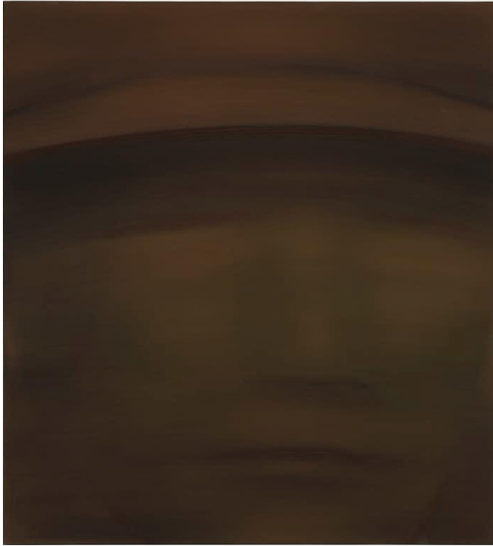
German troupes in Poland post Stalingrad, 2025 Huile sur toile 110 x 100 cm

« C'est à la peinture qu'il incombe de rendre leur présence. Elle le fait par sa propre rareté : Silence pictural, absence d'objets, de décor, jamais un corps entier, rarement toute la tête ; quelques ombres ici et là, des volumes, même pas les couleurs de la peau, Il ne reste que l'à peine : ce qu'on reconnaît comme un tout juste visage. »